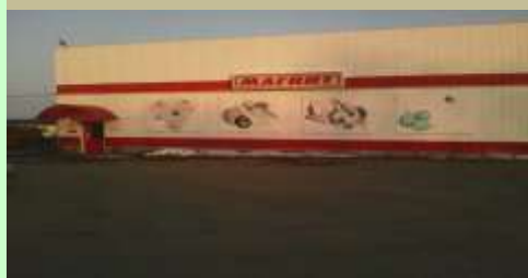
В 2011 году открыт магазин «Магнит»