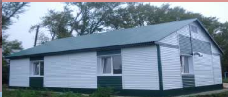
Фельдшерско-акушерский пункт с. Горки, 2014 год

Произведен капитальный ремонт хирургического корпуса в 2012 году. Построено 4 фельдшерско-акушерских пункта в с. Чукалы, с. Киржеманы, с. Кучкаево, с. Горки.