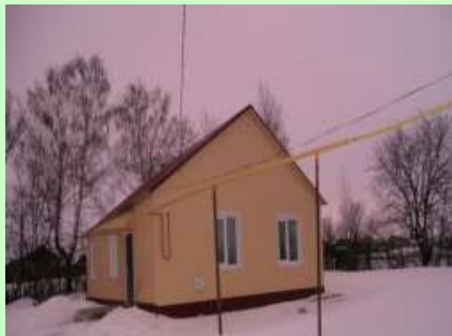
• Фельдшерско-акушерский пункт с. Киржеманы, 2011 год

Произведен капитальный ремонт хирургического корпуса в 2012 году. Построено 4 фельдшерско-акушерских пункта в с. Чукалы, с. Киржеманы, с. Кучкаево, с. Горки.