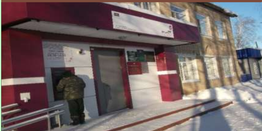
Фасад здания МФЦ

Информационный киоск, где заявители могут подать заявление через портал госуслуг.