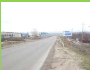
Автодорога «Саранск- Большое Игнатово- Ардатов» выезд в сторону г. Ардатов

общего пользования местного значения Большеигнатовского муниципального района по сельским пунктам составляет 301,9 км.