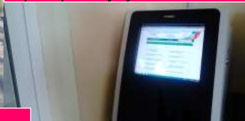
Платежный терминал ОАО «Россельхозбанк»