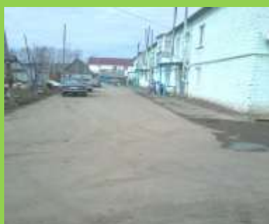
внутридомовая территория многоквартирных домов №6,8 по ул. Гагарина