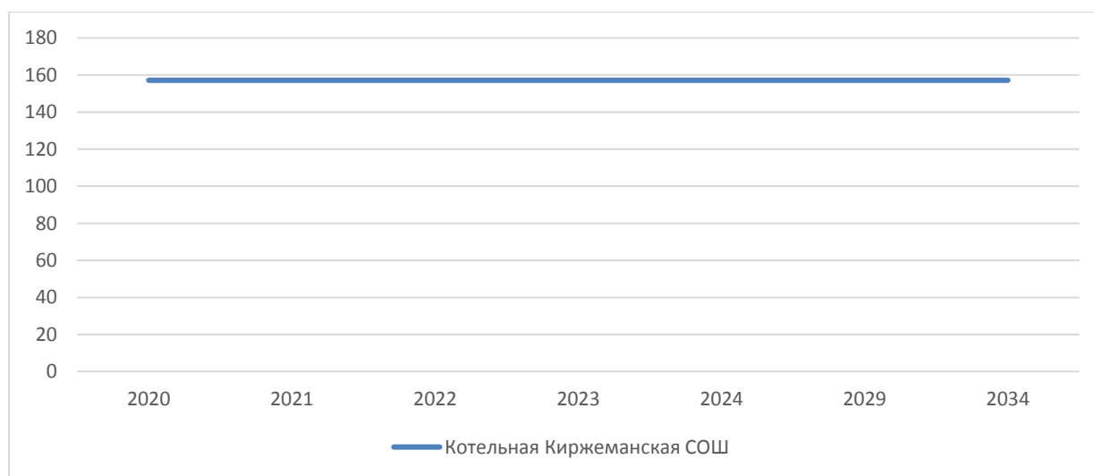
Рисунок 1. Динамика НУР топлива на период 2020-2034 г.г

Прогнозы по отпускаемой тепловой энергии и топливопотреблению рассматривались по котельным, которые задействованы в схеме теплоснабжения, со следующим допущением: производство тепловой энергии ведомственной котельной остаётся на уровне базового года. Перспективное значение удельных расходов топлива на производство тепловой энергии приведено на рисунке 1 и в таблице 11.