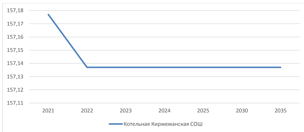
Рисунок 1. Динамика НУР топлива на период 2021-2035 г.г

Прогнозы по отпускаемой тепловой энергии и топливопотреблению рассматривались по котельным, которые задействованы в схеме теплоснабжения, со следующим допущением: производство тепловой энергии ведомственной котельной остаётся на уровне базового года. Перспективное значение удельных расходов топлива на производство тепловой энергии приведено на рисунке 1 и в таблице 11.